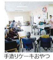
手造りケーキおやつ