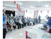
マグロ解体ショー

日常生活の介護を中心に、病院受診や外出、余暇等のお手伝いをいたします。また、食事イベントが多いホームですので屋台、ビアガーデン、マグロ解体ショー等、食べる楽しみや観る楽しみを提供します。