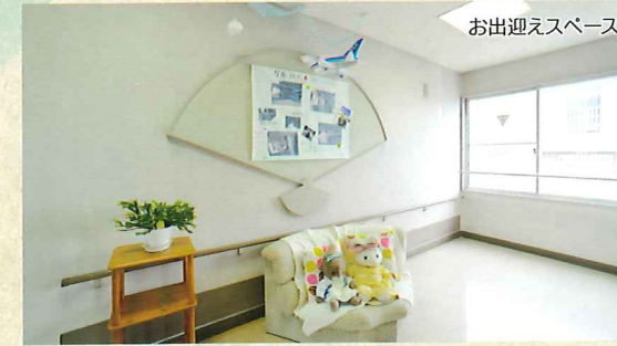
お出迎えスペース