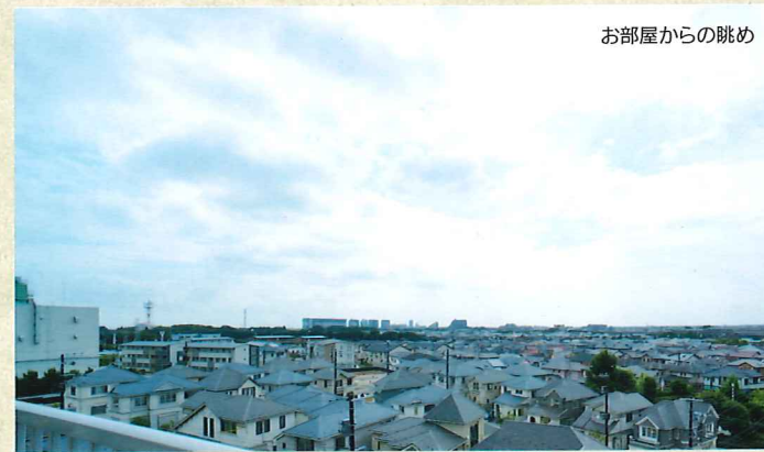
お部屋からの眺め